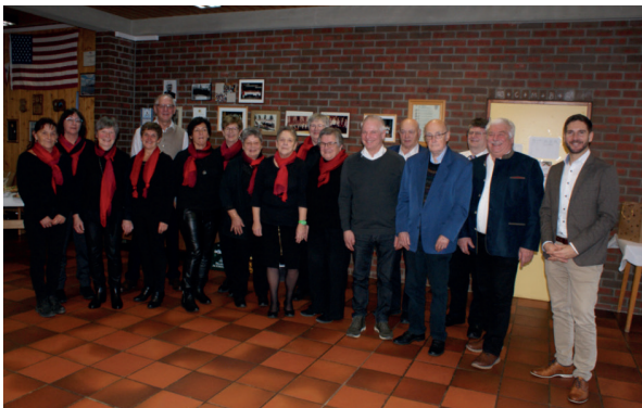
Gemeinsames Stück mit Unterstützung der Chorgemeinschaft